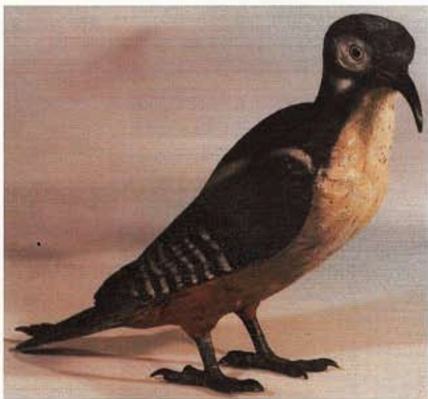
Fig. VIII : « Piciforme ». Taille réelle. Jeu des coloris. Bronze XIX e siècle.