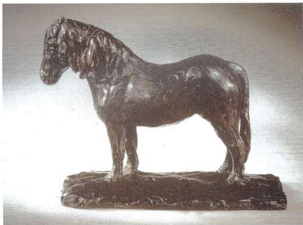
Fig. V. — Rembrandt BUGATTI : « Poney », exemplaire de belle facture au modèle typiquement impressionniste dont les creux et les bosses accrochent la lumière. (Voir page 166).