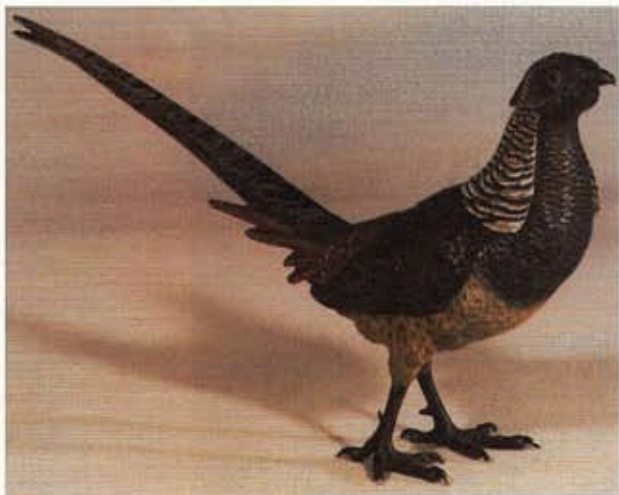
Fig. VII : « Galliforme, la perle des faisans », Vienne, XIX e siècle.