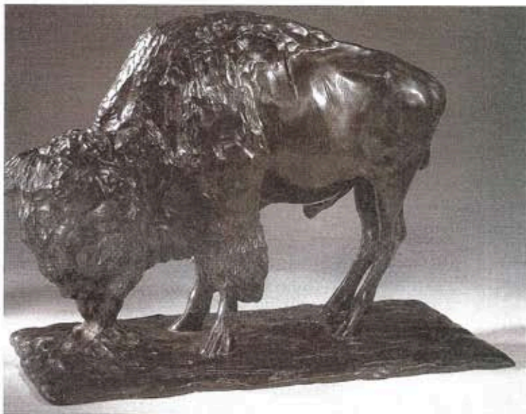
Fig. IV. — BUGATTI: « Bison ». Ce « Bison » illustre la grande habileté de BUGATTI qui allie la forme et la lumière pour parvenir à un ensemble merveilleusement nuancé de force et d'élégance.