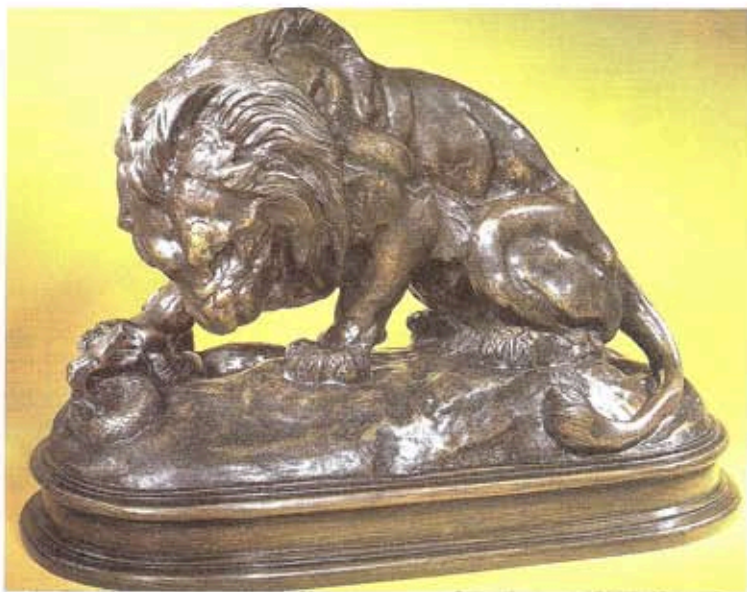
Fig. III. — BARYE: « Lion au serpent ». Le lion était en général réservé aux œuvres maîtresses de BARYE. Bronzes monumentaux, ils étaient ensuite édités en plusieurs tailles comme bronzes d'ornementation, tel ce fameux « Lion au serpent ».