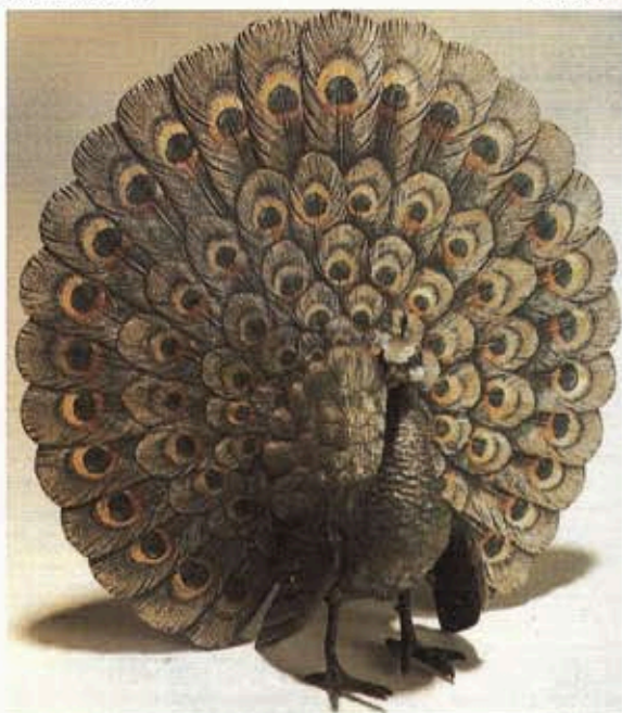
Fig. X : « Le paon ». Beauté et fierté. Superbe travail des coloristes des bronzes de Vienne du XIX e siècle.