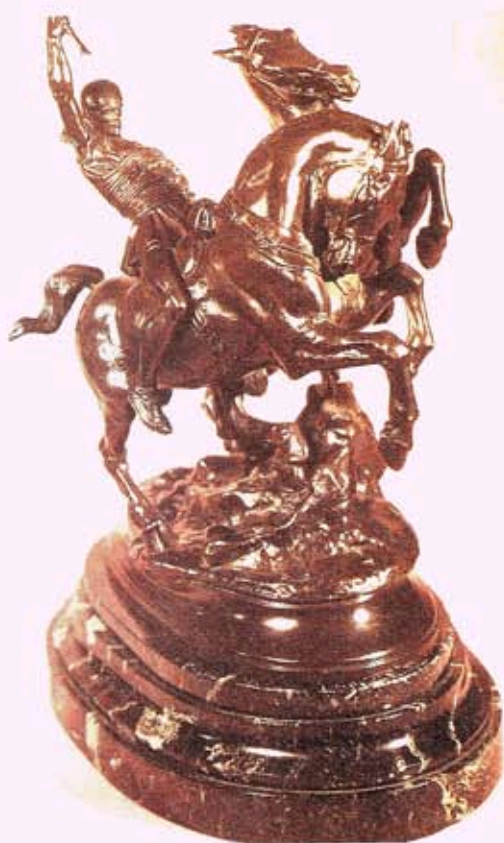
Fig. II. — Emmanuel FRÉMIET: « Le conducteur de char aux deux chevaux », œuvre d'une grande beauté, montée sur un somptueux socle en marbre. (Voir page 102).