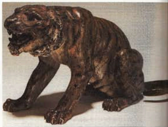
Fig. XII : « Lionne furieuse ». Vienne XIX e siècle.