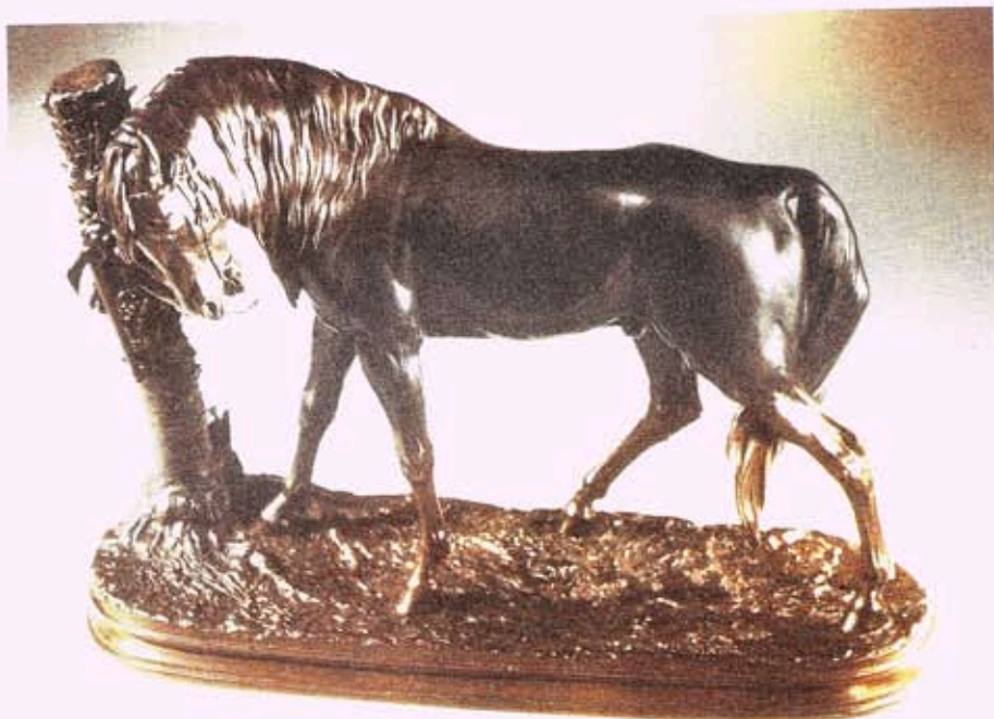
Fig. I. — Pierre-Jules MÈNE: « Le cheval au palmier », magnifique modèle finement ouvragé. (Voir page 114).