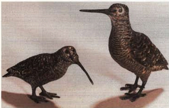
Fig. IX : « Bécasses ». Taille réelle. Vienne, XIX e siècle.