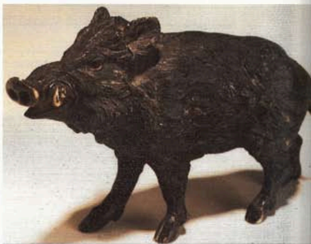
Fig. XI : « Sanglier ». Toute la puissance et le réalisme des bronzes de Vienne du XIX e siècle.